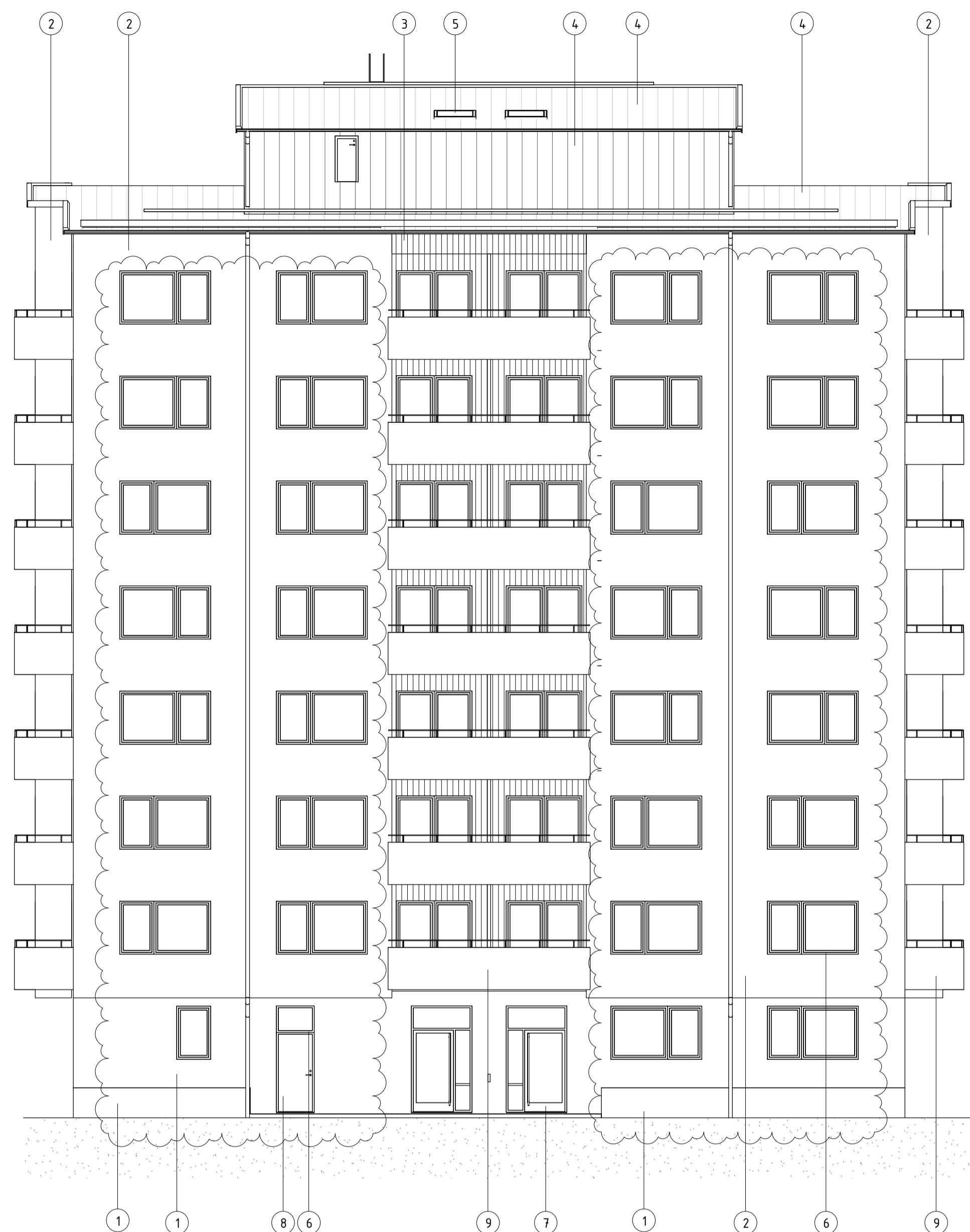
FASAD MOT ÖST