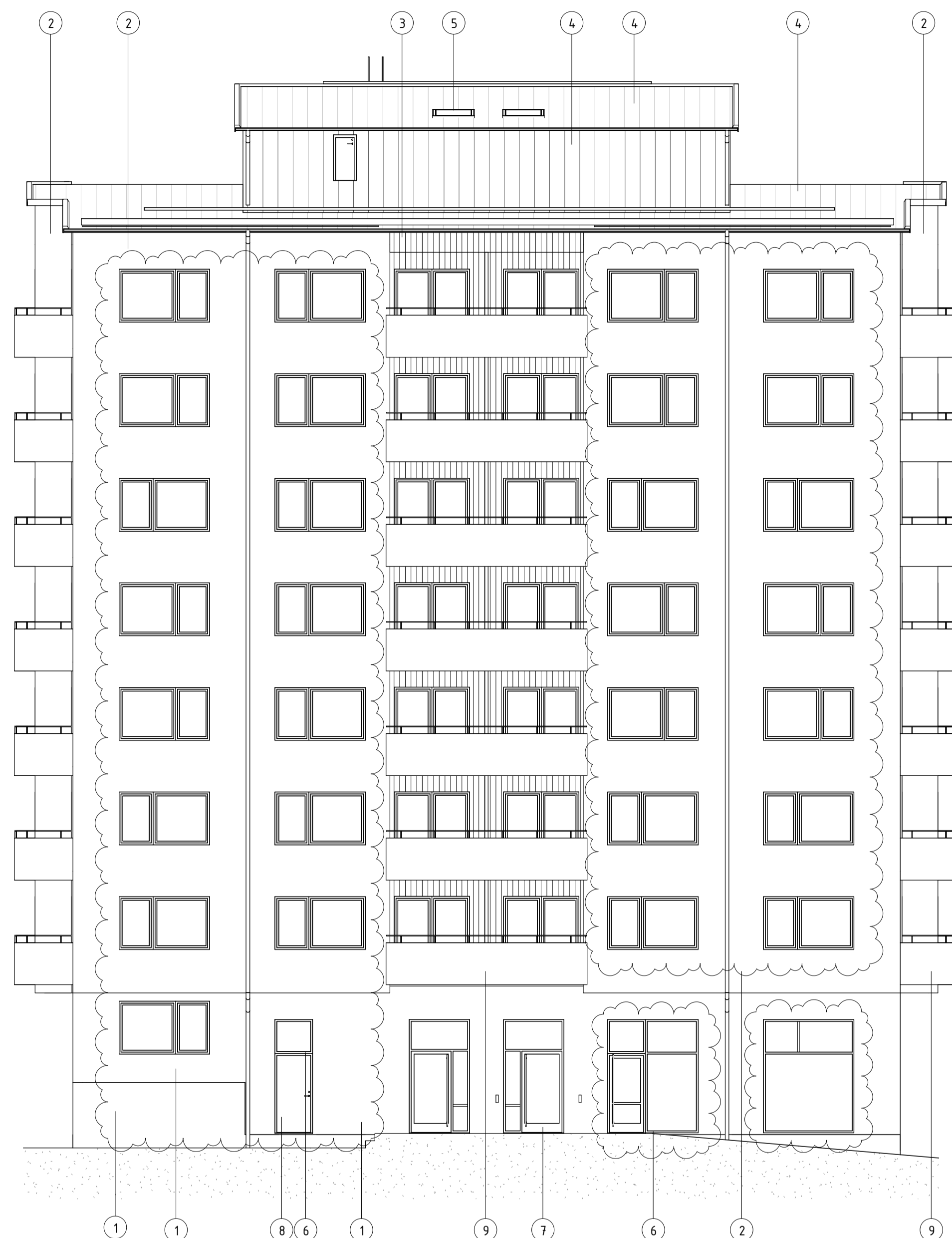
FASAD MOT SYDOST